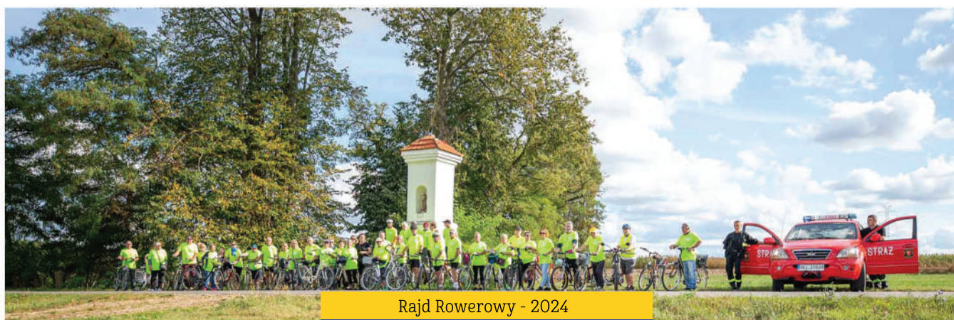
Rajd Rowerowy - 2024