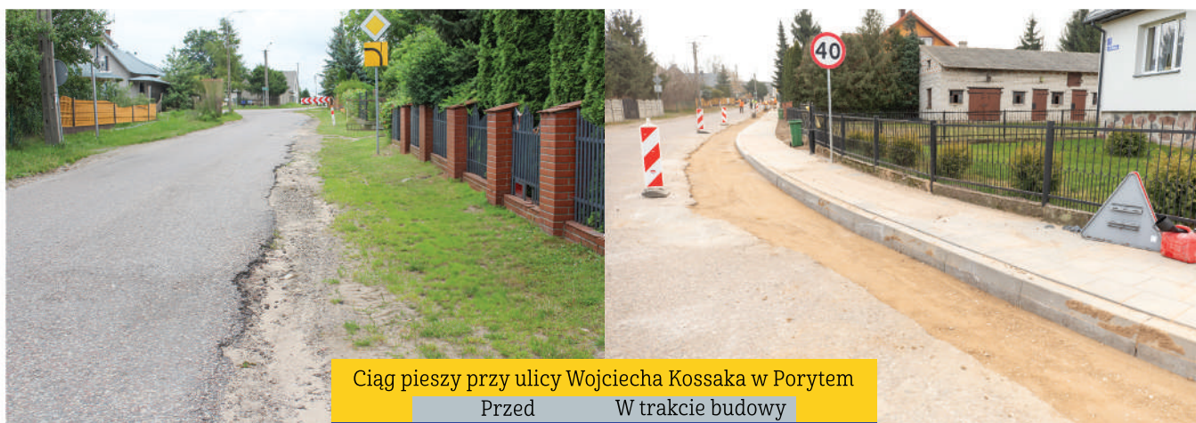
Ciąg pieszy przy ulicy Wojciecha Kossaka w Porytem