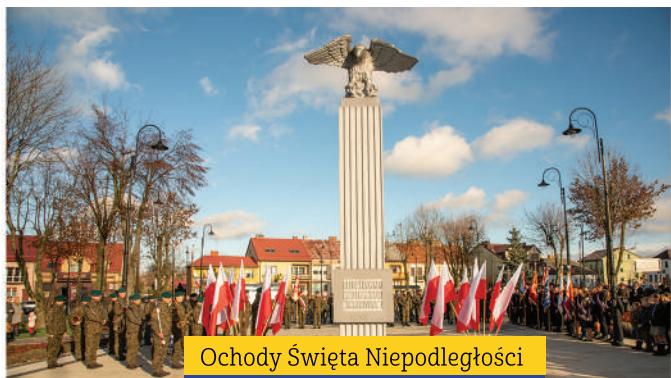
Ochody Święta Niepodległości