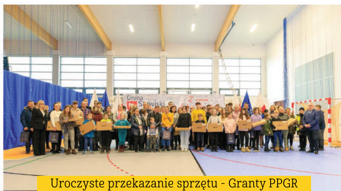
Uroczyste przekazanie sprzętu - Granty PPGR

By docenić i mobilizować do pracy naszych uczniów wprowadziliśmy Stypendia Burmistrza Stawisk, które co roku przyznajemy podczas uroczystej gali. Uroczysty charakter ma również spotkanie z okazji Dnia Edukacji Narodowej, na które zapraszamy również emerytowanych pracowników oświaty.