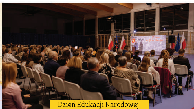
Dzień Edukacji Narodowej