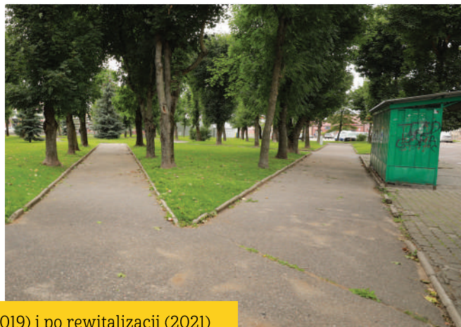
Park w Stawiskach przed (2019) i po rewitalizacji (2021)