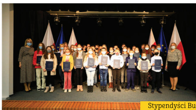
Stypendyści Burmistrza Stawisk