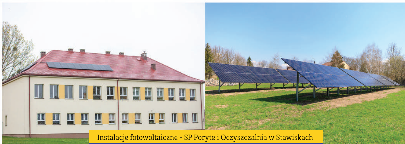
Instalacje fotowoltaiczne - SP Poryte i Oczyszczalnia w Stawiskach