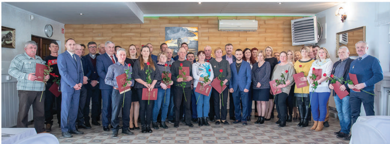
Na zdjęciu Sołtysi z zaproszonymi gośćmi na spotkaniu z okazji Dnia Sołtysa