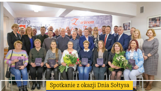
Spotkanie z okazji Dnia Sołtysa