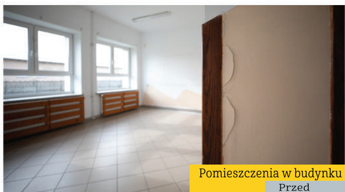
Pomieszczenia w budynku po byłym gimnazjum - CUS

Byliśmy drugą gminą w województwie podlaskim, w której powstało Centrum Usług Społecznych. Instytucja mieści się w dawnym budynku gimnazjum, który dzięki dotacji został przebudowany i dostosowany do nowej roli. W CUS mieszkańcy w potrzebie mogą korzystać z szerszej niż dotychczas oferty wsparcia. Centrum oferuje nie tylko usługi socjalne, ale także m.in. wsparcie psychologa, fizjoterapeuty, pielęgniarki czy poradnictwo prawne, prowadzone są także sąsiedzkie usługi opiekuńcze oraz wypożyczalnia sprzętu rehabilitacyjnego. Centrum jest miejscem, w którym mieszkańcy Gminy Stawiski – wszyscy, i sprawni, i z niepełnosprawnościami, młodzi i starsi, oraz całe rodziny – otrzymają kompleksowe wsparcie.