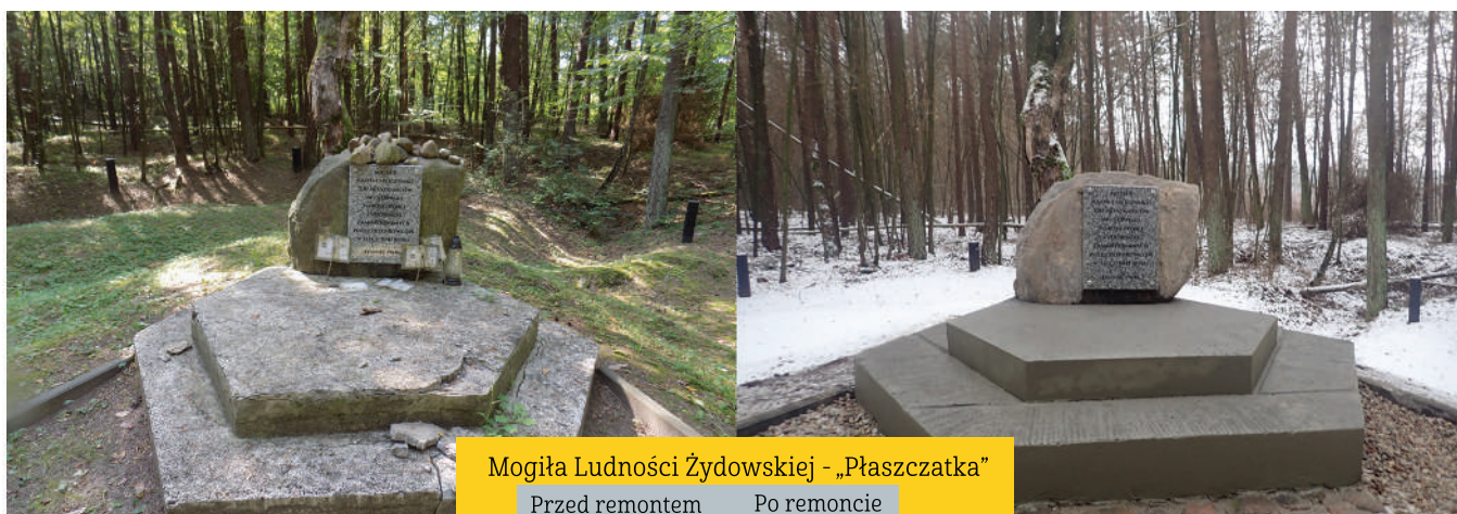
Mogiła Ludności Żydowskiej - „Płaszczatka” Przed remontem Po remoncie