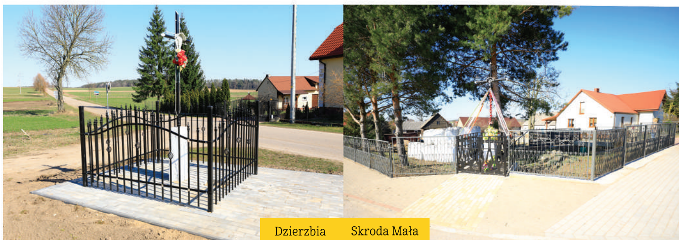
Dzierzbia Skroda Mała

W trosce o bezpieczeństwo mieszkańców wykonaliśmy oświetlenie solarne w Jurcu Szlacheckim (od Jurca Folwark w kierunku szkoły), Michnach, Porytem, a także oświetlenie na tzw. „Rutce” w Dzierzbi i przy drodze Taflę - Michny.