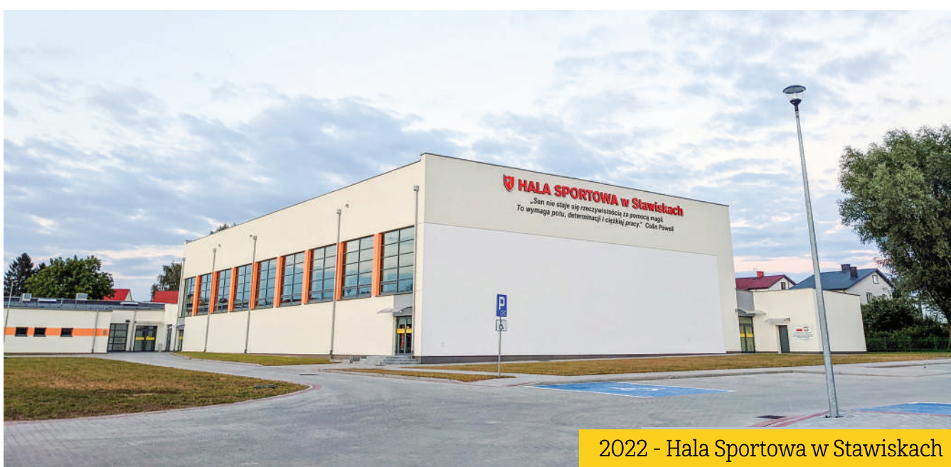
2022 - Hala Sportowa w Stawiskach