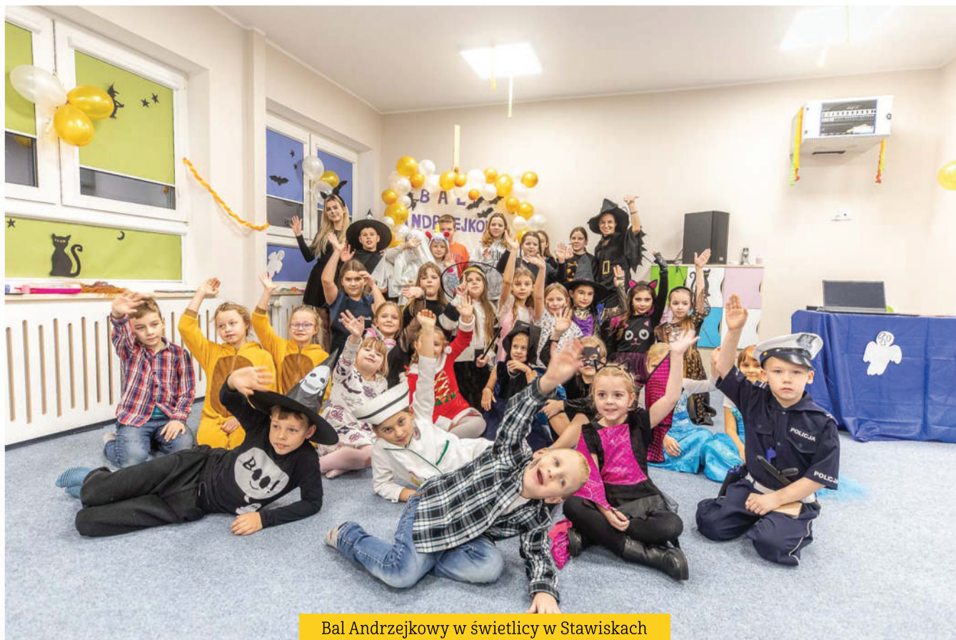
Bal Andrzejkowy w świetlicy w Stawiskach