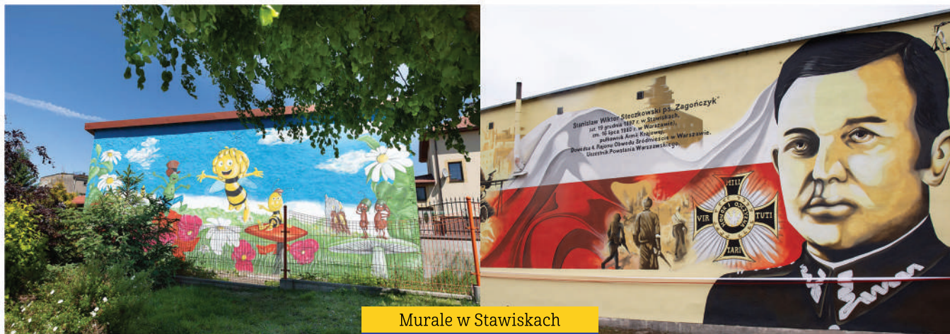
Murale w Stawiskach

Piękne skwery powstały w Stawiskach, ale też w Romanach i Wysokim Dużym. Cieszą wyremontowane kapliczki w Dzierzbi oraz krzyże przydrożne w Dzierzbi, Ignaciewie, Zaborowie, Grabówku, Budach Stawiskich, Budach Poryckich, Jurcu Włociańskim. Przed nami jest modernizacja krzyży przydrożnych w kolejnych miejscowościach.