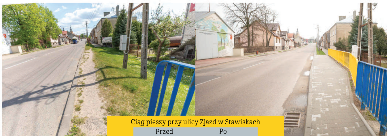
Ciąg pieszy przy ulicy Zjazd w Stawiskach

Zadbaliśmy, by przy Cmentarzu w Stawiskach oraz przy ul. Łomżyńskiej był nowy parking. Przebudowaliśmy parking przy „Ośrodku Zdrowia”.