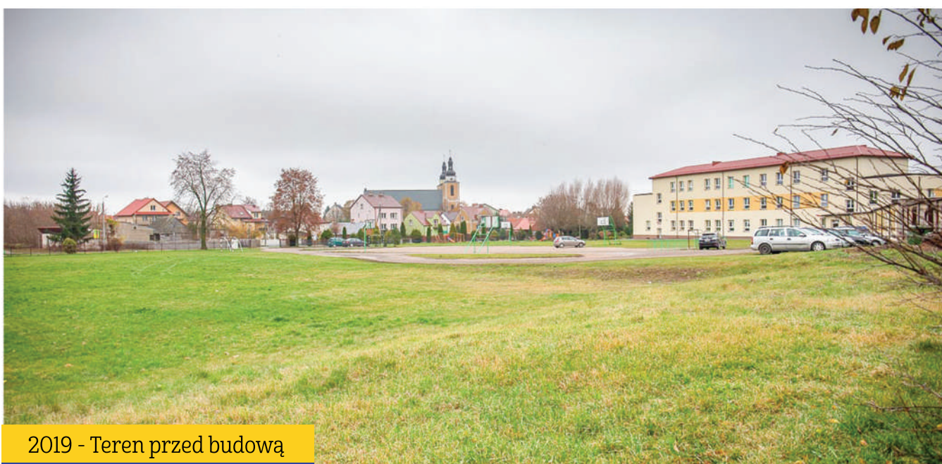
2019 - Teren przed budową

Zacznijmy od inwestycji, która przez dekady była tylko marzeniem albo mglistym planem – hali sportowej w Stawiskach. Nam nie tylko udało się pozyskać środki na tę ogromną inwestycję, ale też skutecznie rozwiązać kilka wyzwań pojawiających się już w trakcie realizacji. Dziś w Stawiskach mamy nie tylko halę sportową dostępną dla naszych uczniów i dla mieszkańców, ale dodatkowo też siłownię oraz łącznik ze szkołą, w którym miejsce znalazły m.in. szatnie, łazienki, stołówka oraz gabinety logopedy i pedagoga. Powierzchnia nowo wybudowanego kompleksu to prawie 2700 m 2 , z czego sam budynek łącznika to niespełna 820 m 2 . Ponad 70% kosztów inwestycji pokryły dotacje, które pozyskaliśmy m.in. z Ministerstwa Sportu i Turystyki, Rządowego Funduszu Inwestycji Lokalnych oraz ze środków PFRON będących w dyspozycji Marszałka Województwa Podlaskiego.