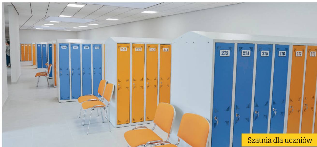
Szatnia dla uczniów