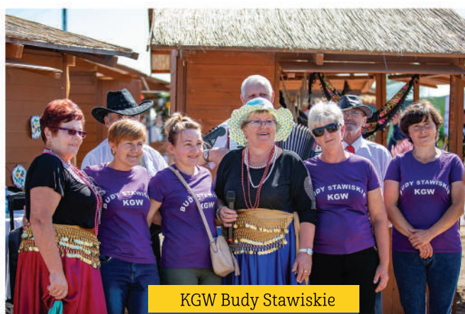
KGW Budy Stawiskie