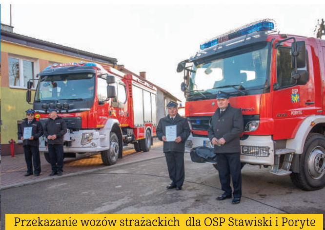
Przekazanie wozów strażackich dla OSP Stawiski i Poryte