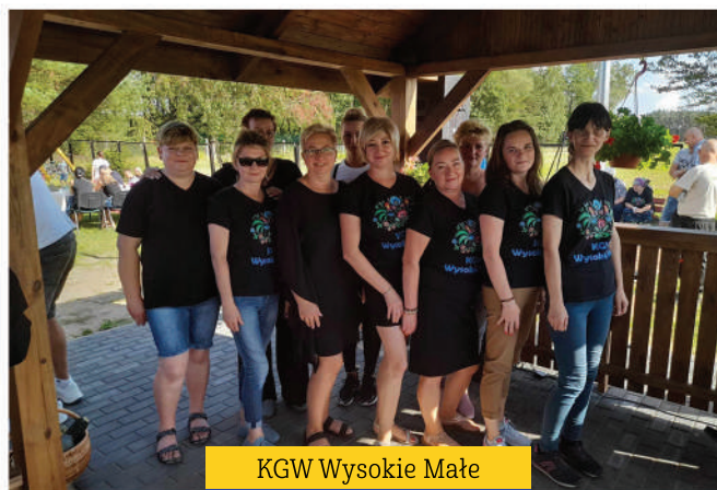
KGW Wysokie Małe