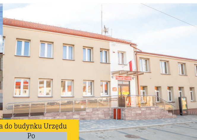
Przebudowa wejścia do budynku Urzędu