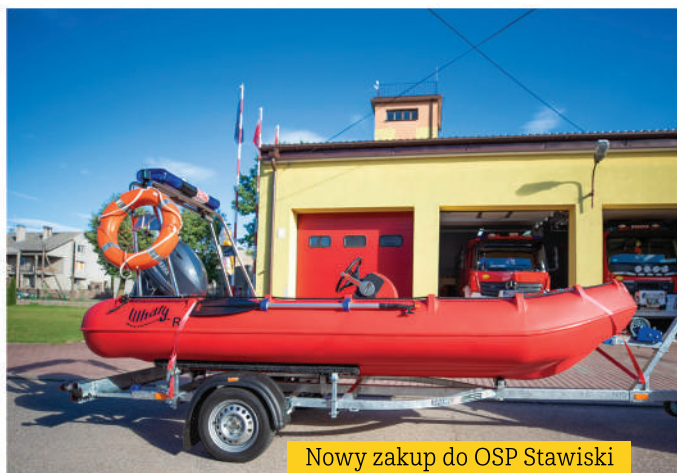
Nowy zakup do OSP Stawiski

Bardzo wiele środków w ostatnich latach pozyskaliśmy, by doposażyć w wozy, sprzęt i umundurowanie naszych strażaków ochotników. Nowe wozy otrzymały jednostki OSP Stawiski i OSP Wysokie Małe, przekazanie samochodu nastąpiło do OSP Poryte. Natomiast OSP Dzierzbia wzbogaciła się o łódkę. W tej kadencji włączyliśmy również OSP Poryte do Krajowego Systemu Ratowniczo - Gaśniczego.