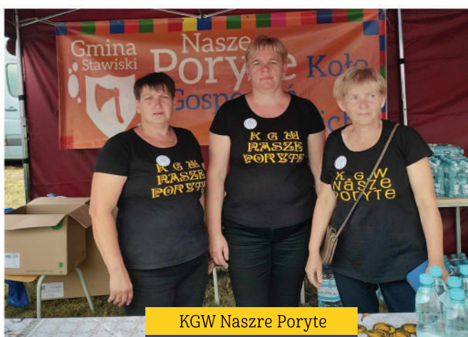
KGW Nasze PorzYTE