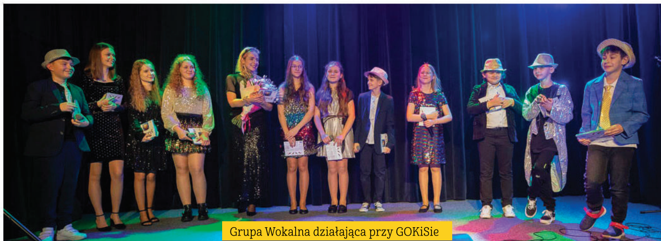
Grupa Wokalna działająca przy GOKiSie