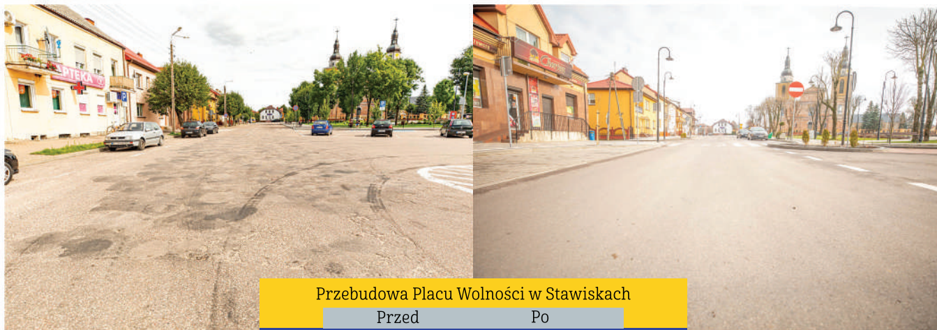
Przebudowa Placu Wolności w Stawiskach