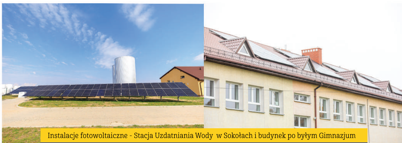
Instalacje fotowoltaiczne - Stacja Uzdatniania Wody w Sokołach i budynek po byłym Gimnazjum

Dodatkowo pozyskiwaliśmy dotacje, dzięki którym mieszkańcy Naszej Gminy mogli pozbyć się azbestu, folii czy zamontować instalacje OZE. Realizowane w minionych latach projekty to: „Usuwanie wyrobów zawierających azbest z terenu gminy Stawiski”, „Usuwanie folii rolniczych i innych odpadów pochodzących z działalności rolniczej”, „Instalacje OZE dla Mieszkańców Gminy Stawiski” oraz „Energia słoneczna w Gminie Stawiski”.