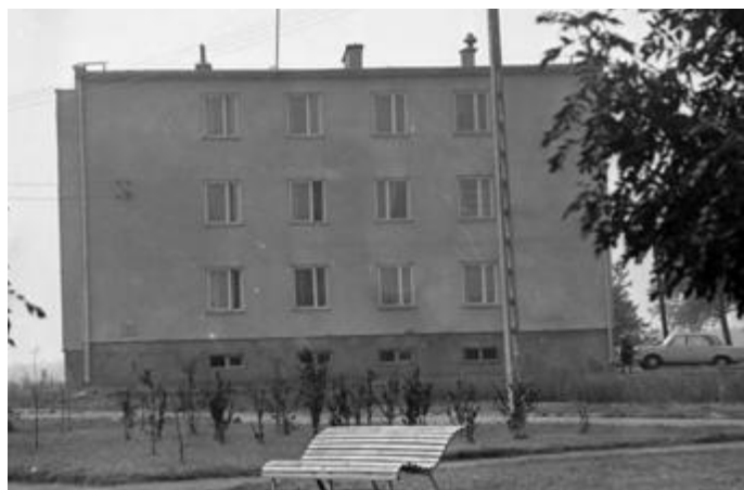
Smolniki na początku lat 70-tych XX w. Widok na blok Smolniki 7 popularnie nazywany „dwunastką”