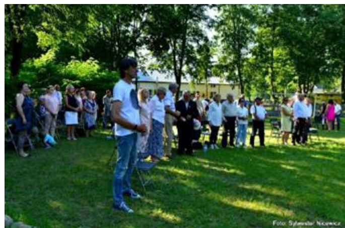
Jubileusz SPJ przyciągnął nie tylko mieszkańców Jurca