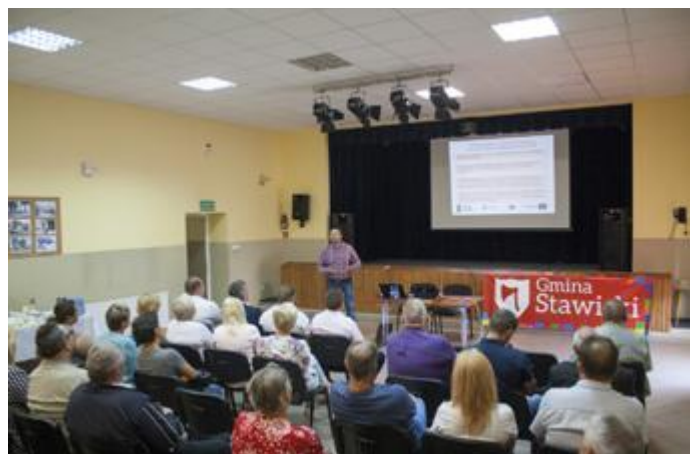
Uczestnicy konferencji w GOKiS w Stawiskach

LPR zawiera działania dotyczące najbliższych mieszkańcom gminy Stawiski lokalizacje. Z tego powodu jego założenia wywołały ożywioną dyskusję wśród zebranych. Taki był jednak cel spotkania, gdyż podstawowym celem procesu rewitalizacji jest aktywne uczestnictwo miejscowych w programowaniu, prowadzeniu i ocenie LPR Gminy Stawiski.