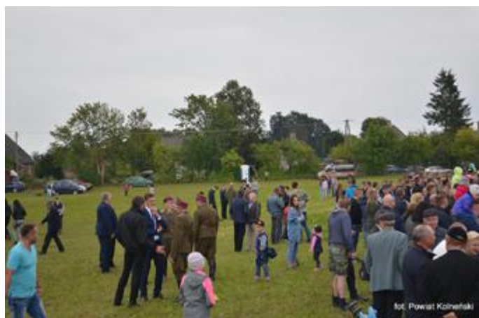
Podczas Pamięci Września 1939 roku w Grabowie 17 września br.