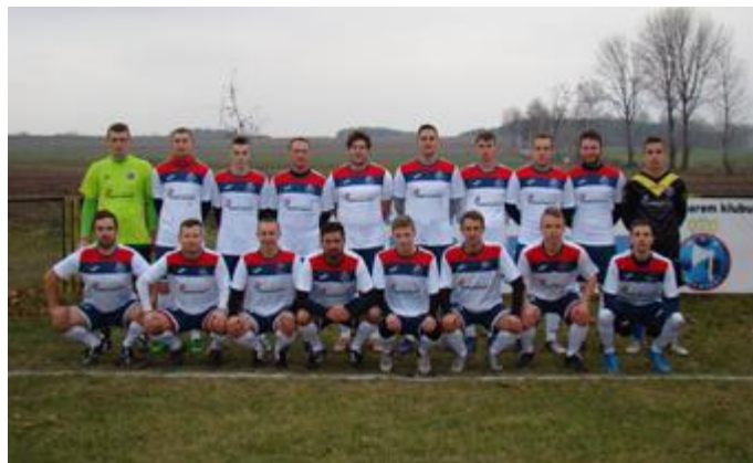
Drużyna GKS Stawiski w „domowych strojach”

Do ligi okręgowej awansem premiowany jest tylko zwycięzca każdej z trzech grup klasy A.