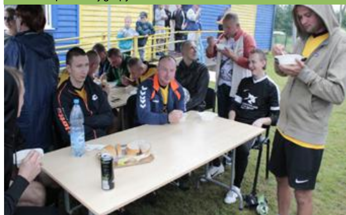
W przerwie między meczami zawodnicy mieli możliwość zjedzenia „regeneracyjnej grochówki”