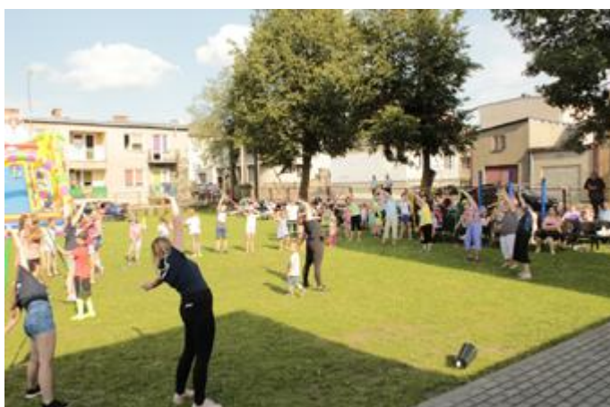
Uczestnicy biorą udział w międzypokoleniowym aerobiku

Oprawę muzyczną Międzypokoleniowego Pikniku Sportowego zapewnił miejscowy zespół RFT-2.