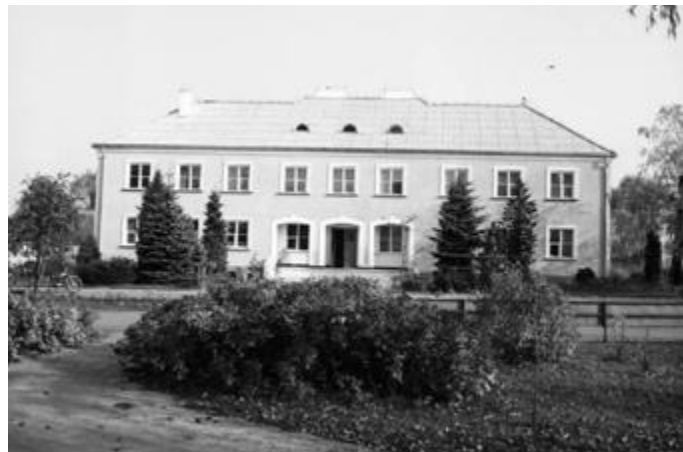
Widok na budynek biurowca. Obecnie należy do Firmy Prywatnej Koja w Stawiskach

Obecnie budynek dawnego biurowca jest własnością Firmy Prywatnej Koja w Stawiskach.