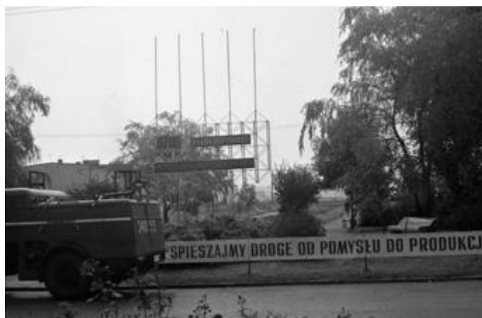
Smolniki na początku lat 70-tych XX w. Widok na park od strony biurowca