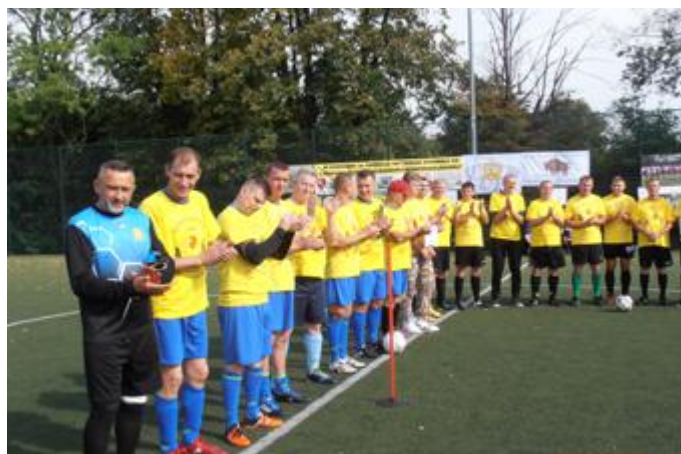
Uczestnicy podczas otwarcia Turnieju zaprezentowali się w jednakowych, żółtych koszulkach z hasłem: Żyć aktywnie i być młodym do starości