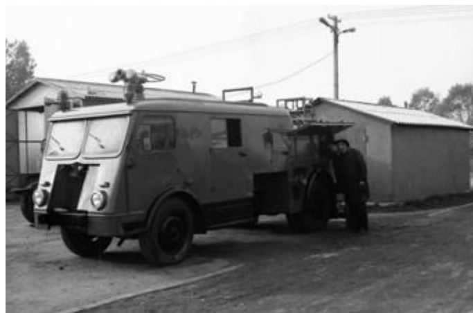
POM Smolniki słynął na całą Polskę z remontów wozów strażackich