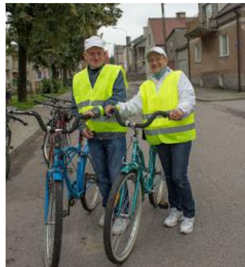
P. Podbielscy przygotowują się do wyjazdu

na. Uczestnicy wyruszyli spod GOKiS w Stawiskach i planowo mieli przejechać przez Cedry, Rostki oraz Smolniki. W trakcie jazdy jednak, na życzenie uczestników, trasa została zmodyfikowana i rowerzyści odwiedzili również miejscowość Cwaliny. Uczestnicy pokonali blisko 16 km.