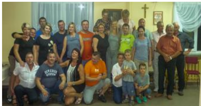
Członkowie KGW Dzierzbia potrafią zgromadzić się wokół wspólnego celu

5 sierpnia br. na terenie dawnej Szkoły Filialnej Szkoły Podstawowej w Porytem w Dzierzbi odbyło się integracyjne ognisko, w którym udział wzięli mieszkańcy miejscowości oraz zaproszeni goście.