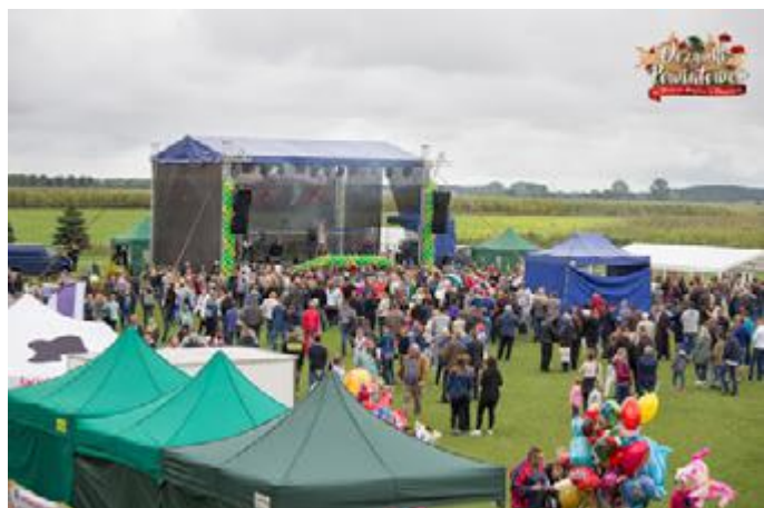
Dożynki Powiatowe 2017 w Stawiskach

Szczególne wrażenie zrobiła jednak oprawa scenograficzna Dożynek Powiatowych 2017. Na drodze do kościoła korowód dożynkowy przywitali olbrzymi gospodarz oraz gospodyni, wykonani z bali słomy, a także kot, uśmiechnięta krasula, świnka z trzema prosiakami. Natomiast na Stadionie goście zobaczyli kolejne scenki rodzajowe: Rodzinka 500+ z informacją Kupa dzieci, większe zyski, na dożynki