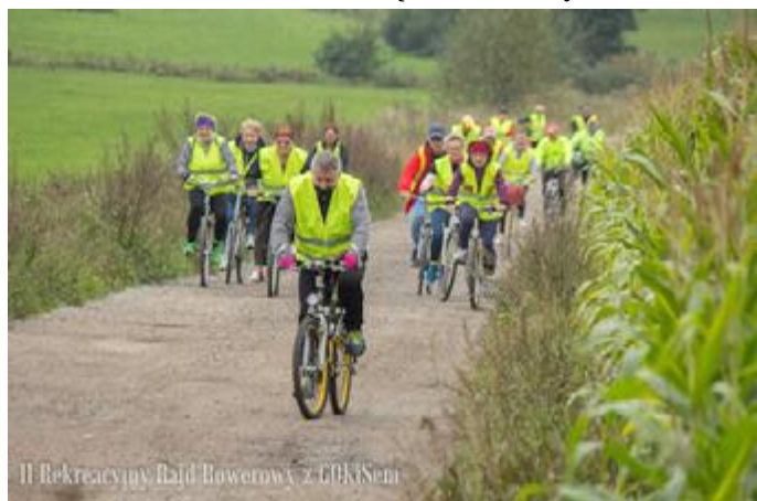
Cykliści dzielnie pokonują wzniesienie prowadzące „na Kozie Góry”

Również w tym roku rajd cieszył się dużym zainteresowaniem mieszkańców gminy Stawiski. Na starcie zameldowali się również cykliści z Kol-