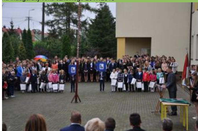
Wszystkie spojrzenia kierowały się na pierwszoklasistów