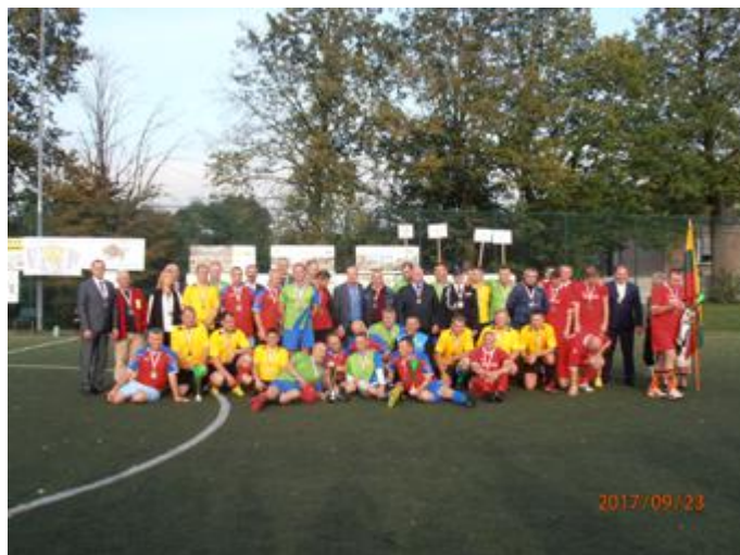
Uczestnicy Turnieju pozują do pamiątkowego zdjęcia

VII Międzynarodowy Turniej Oldbojów Stawiski 2017 zorganizowany został przez Stowarzyszenie Integracyjno-Sportowe w Stawiskach przy zaangażowaniu Zespołu Szkolno-Przedszkolnego w Stawiskach oraz Gminnego Ośrodka Kultury i Sportu w Stawiskach.