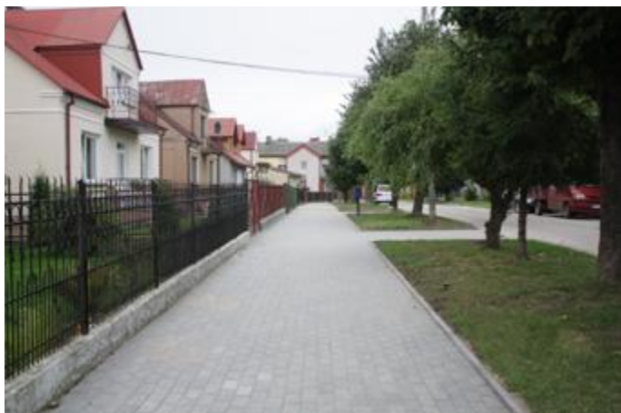
Zmodernizowany chodnik przy ul. Projektowanej w Stawiskach

Realizacja zadań w ramach funduszu sołeckiego na 2017 rok na terenie miasta Stawiski przebiegła bez zastrzeżeń. Mieszkańcy korzystają ze zmodernizowanej nawierzchni części chodników, a w Gminnym Ośrodku Kultury i Sportu w Stawiskach zakupiono i zamontowano rzutnik.