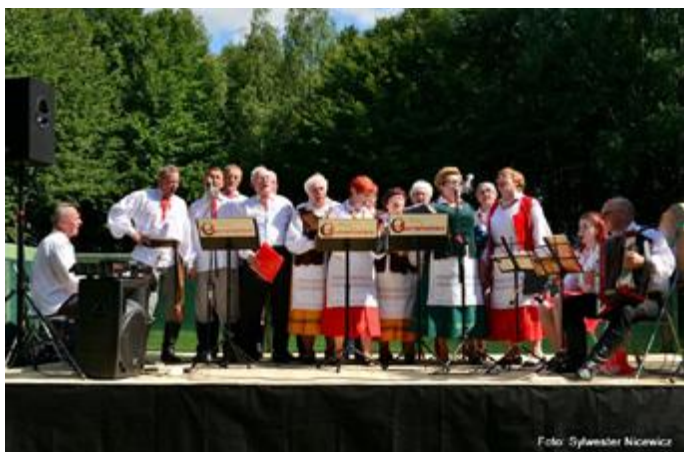
Zespół Czerwieniacy podczas występu wprowadza w ludowy nastrój