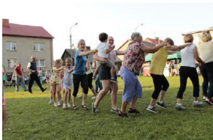
Organizatorzy zaplanowali różne gry i zabawy