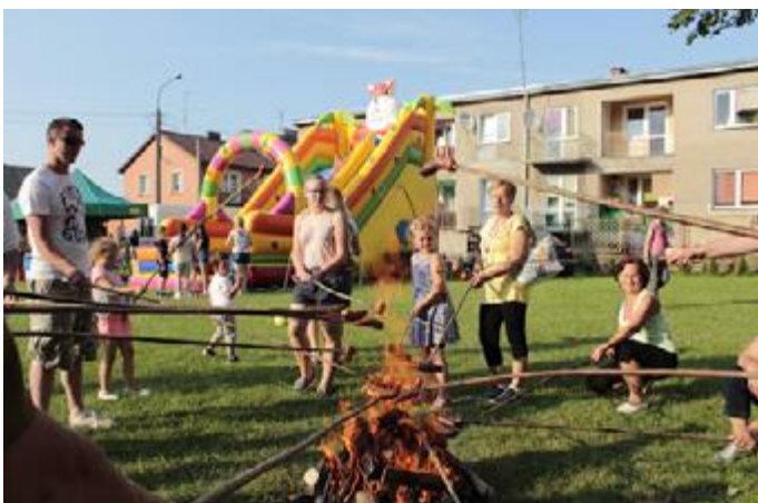
Ku uciechu zgromadzonych Piknik przewidywał tradycyjne smażenie kiełbasek