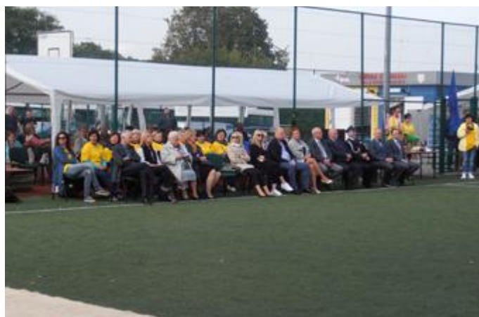
Rozgrywki piłkarskie oglądało wielu znamienitych gości

Uczestnicy niezmiennie twierdzą, że najważniejsza jest dla nich sama możliwość wzięcia udziału w rozgrywkach. Dla oldbojów nieważny jest wynik końcowy. Cieszą się, że pomimo przekroczenia bariery 35 lat, w zdrowiu i bez kontuzji mogą grać regularnie w piłkę nożną, a na cotygodniowych treningach nierzadko skutecznie rywalizują z dużo młodszymi kolegami.