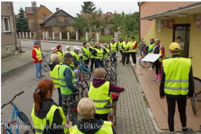
Na starcie przy GOKiS w Stawiskach pojawiło się kilkudziesięciu uczestników

17 września br. w niedzielne popołudnie odbył się II Rekreacyjny Rajd Rowerowy zorganizowany przez Stowarzyszenie Kół Gospodyń Wiejskich Gminy Stawiski oraz Gminny Ośrodek Kultury i Sportu w Stawiskach.