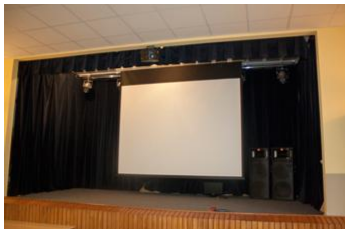
Nowy rzutnik dla GOKiS zakupiony w ramach funduszu sołeckiego

W ramach funduszu sołeckiego zrealizowano również zadanie: „Zakup rzutnika na potrzeby GOKiS w Stawiskach”.