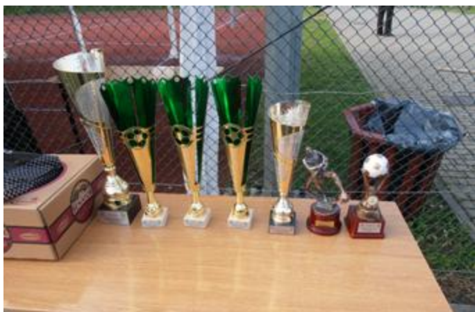
Impreza była objęta Patronatem Starosty Kolneńskiego

Rozgrywki piłkarskie dostarczyły niemałych emocji, a zwycięsko z rywalizacji wyszła drużyna Oldboj Stawiski. Uczestnicy turnieju niezmiennie udowodnili, że wiek na boisku o niczym nie świadczy, a zaprezentowanej kondycji fizycznej może im pozazdrościć niejeden młodzieniaszek. Ciekawostką jest fakt, iż najstarszy zawodnik turnieju miał 75 lat.