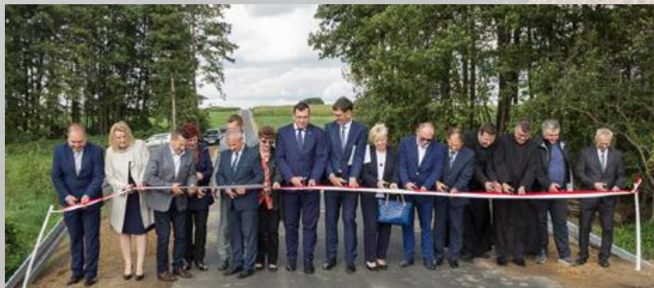
Długo wyczekiwany przez mieszkańców moment „przecięcia wstęgi”

Działanie jest zgodne z założeniami planu Rozwoju Lokalnego Gminy Stawiski na lata 2015-2020, tj. poprawa i rozbudowa infrastruktury komunikacyjnej w obszarze gminy.