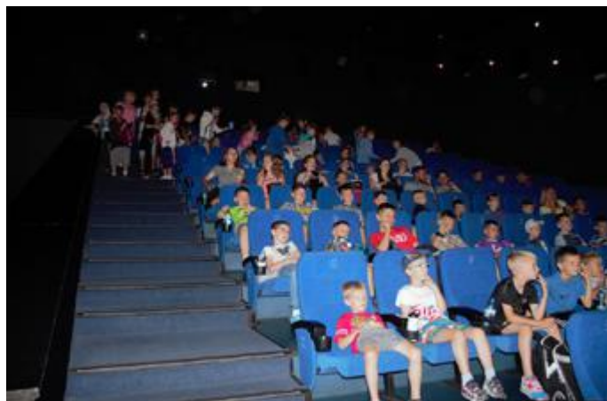
Młodzież ogląda film w Kinie Helios w Białymstoku Fot. GOKiS w Stawiskach