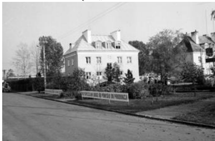
Smolniki na początku lat 70-tych XX w. Widok na blok mieszkalny Smolniki 3 i Smolniki 4