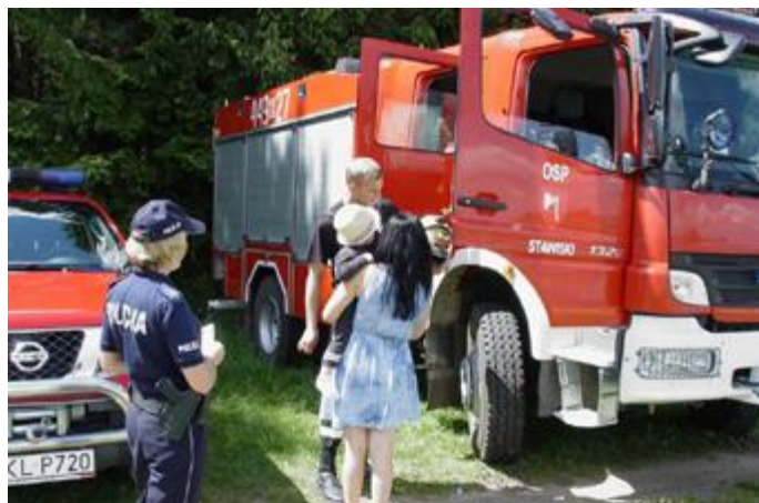
Pogadanka o bezpieczeństwie nad wodą oraz prezentacja sprzętu OSP KSRG Stawiski

Akcja miała na celu zminimalizowanie wystąpienia nieodpowiedzialnych zachowań podczas letniego wypoczynku na wodą.