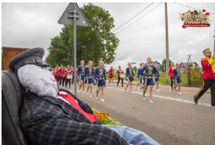
Korowód dożynkowy mija rolnika szukającego żony

Niezwykłe wieńce dożynkowe przygotowali członkowie Stowarzyszenia Przyjaciół Jurca oraz Koła Gospodyń Wiejskich w Budach Stawiskach.