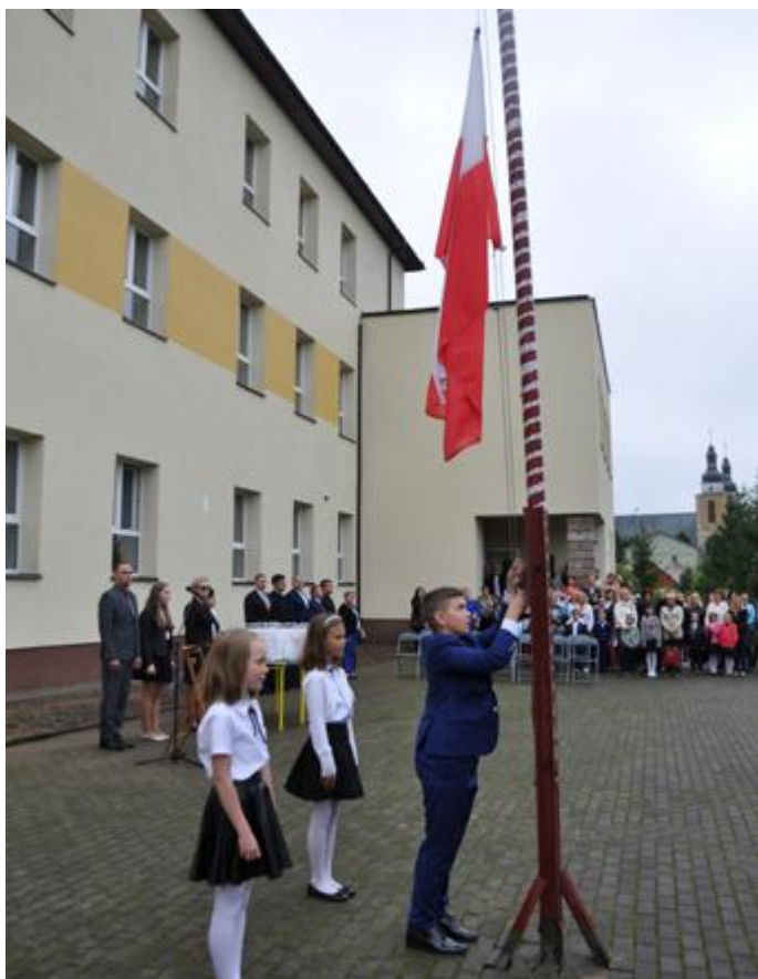
Delegacja uczniów wciąga flagę państwową na maszt