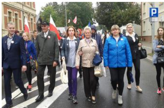
SPJ uczestniczą w XVII Marszu Pamięci Zesłańców Sybiru ulicami Białegostoku 8 września br.