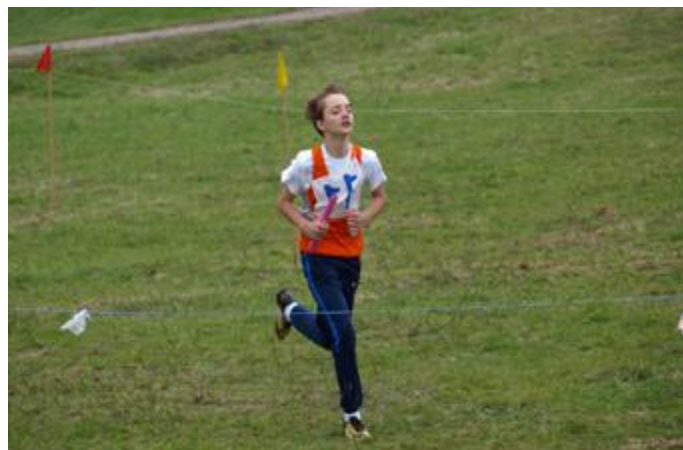
Młodzi lekkoatleci zaprezentowali się dobrej strony, ale awans uzyskała tylko ekipa dziewcząt w kategorii „dzieci”

Kolejny etap eliminacji w Nowogrodzie odbył się 7 października br. Oprócz zwycięskiej drużyny dziewcząt w zawodach w grupie wiekowej „dzieci” uczestniczyli również chłopcy, jednak nie uzyskali awansu. W podobnej sytuacji znalazły się reprezentacje ze Stawisk w grupie wiekowej „młodzież szkolna”. Tu do premiowanego awansem piątego miejsca zabrakło niewiele – dziewczęta zajęły siódmą lokatę, zaś chłopcy szóstą.