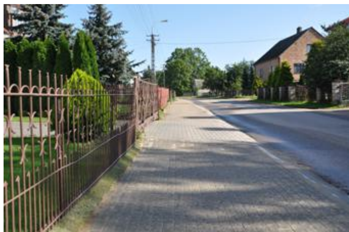
Chodnik w miejscowości Sokoły