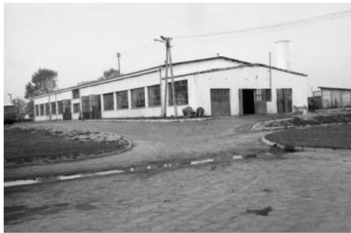
POM Smolniki - hala montażu skrzyń biegów