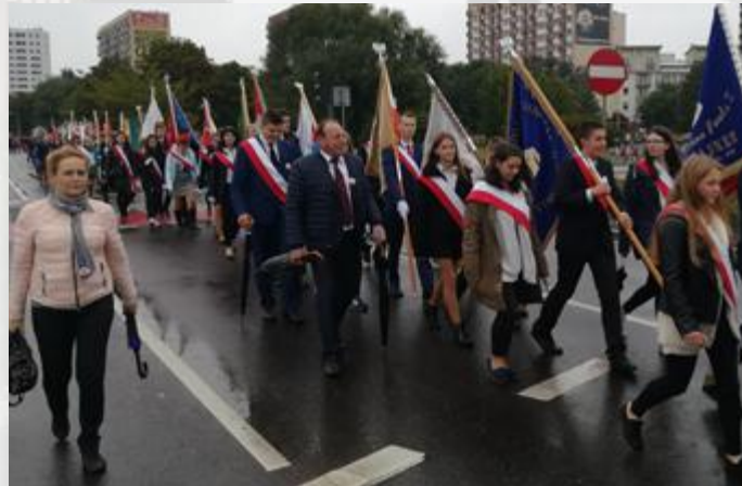
Poczty sztandarowe placówek oświatowych gminy Stawiski maszerują ulicami Białegostoku

W tym roku marszowi towarzyszyło hasło: Ojczyzna W Naszych Sercach I Pamięci .