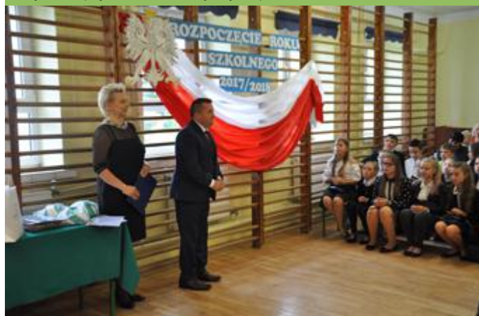
Na inauguracji roku szkolnego w SP Poryte przemawia Przewodniczący Rady Miejskiej w Stawiskach Józef Zalewski