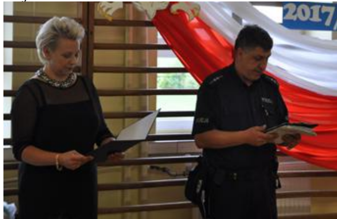
Dzielnicowy przedstawia założenia akcji Bezpieczna droga do szkoły

Dzielnicowy przypomniał również założenia akcji Dzielnicowy bliżej nas oraz zachęcał do kontaktu, w tym również poprzez aplikację na smartfony Moja komenda .