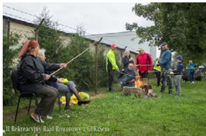
Na mecie organizatorzy przewidzieli integracyjne ognisko

Rajd zbiegł się z innym sportowym wydarzeniem na stadionie. Swoją mecz rozgrywała bowiem miejscowa drużyna GKS Stawiski. Mecz z KS Grabówka zakończył się zwycięstwem gospodarzy 2:0.