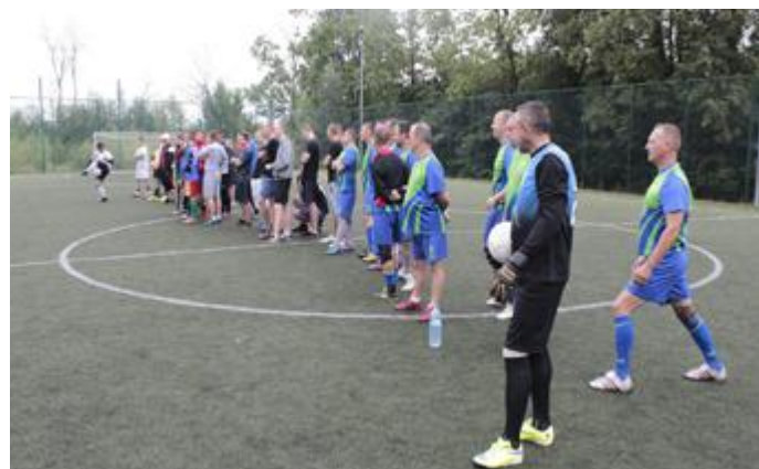
Ze względu na dużą ilość uczestników drużyny zostały podzielone na dwie grupy