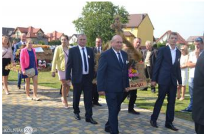
Delegacja z parafii Stawiski - mieszkańcy wsi Chmielewo oraz Cwaliny