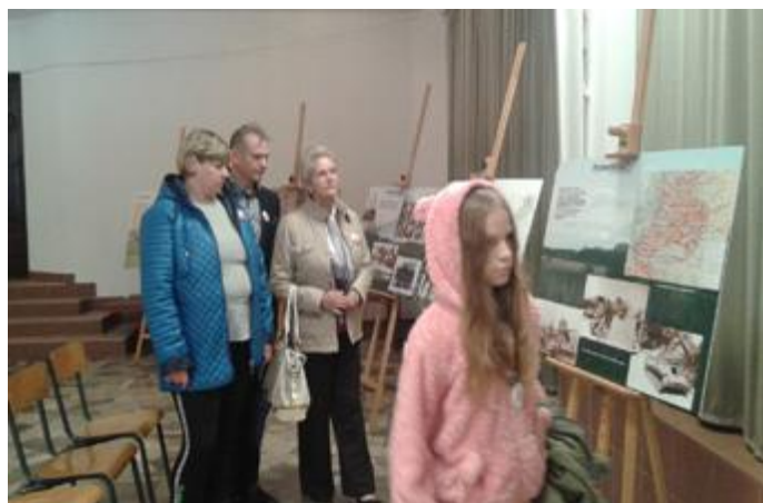
Wystawa poświęcona pamięci Sybiraków