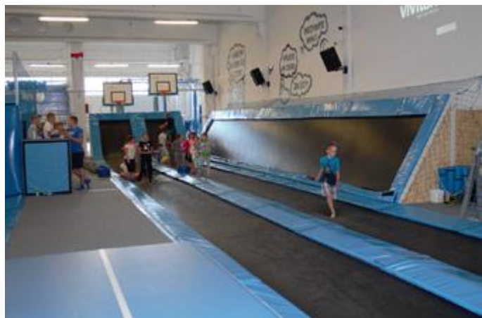
Strefa Wysokich Lotów w Białymstoku

Plan wycieczki obejmował wizytę w Strefie Wysokich Lotów oraz seans filmowy w Kinie Helios w Białymstoku.