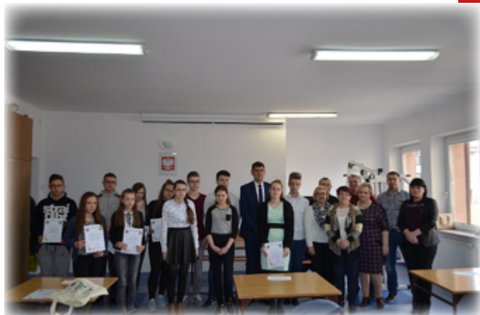
Tekst: UM Stawiski

Jesteśmy dumni, że wiedza pożarnicza wśród naszej młodzieży stoi na coraz wyższym poziomie. Jednocześnie gratulujemy i życzymy dalszych sukcesów w konkursie.