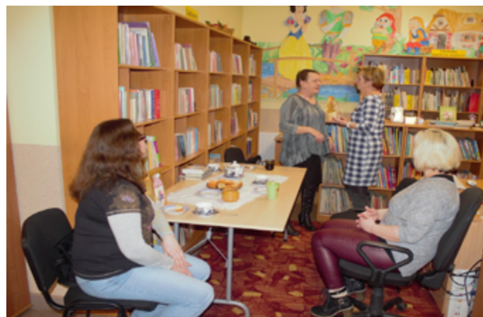
Tekst: UM Stawiski

Zwycięzcy pokazują, że w dobie silnego oddziaływania wirtualnej rzeczywistości na naszą codzienność można jeszcze znaleźć czas na odbycie najtańszej podróży w świat literatury.