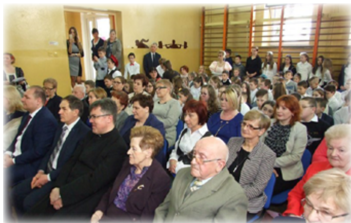
Tekst: UM Stawiski