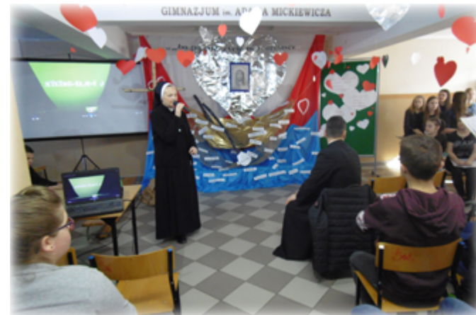
Tekst: UM Stawiski