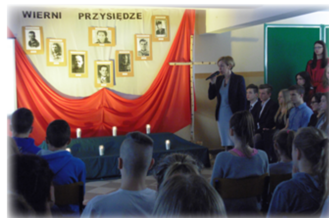
Tekst: UM Stawiski