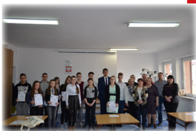
Tekst: UM Stawiski

Jesteśmy dumni, że wiedza pożarnicza wśród naszej młodzieży stoi na coraz wyższym poziomie. Jednocześnie gratulujemy i życzymy dalszych sukcesów w konkursie.