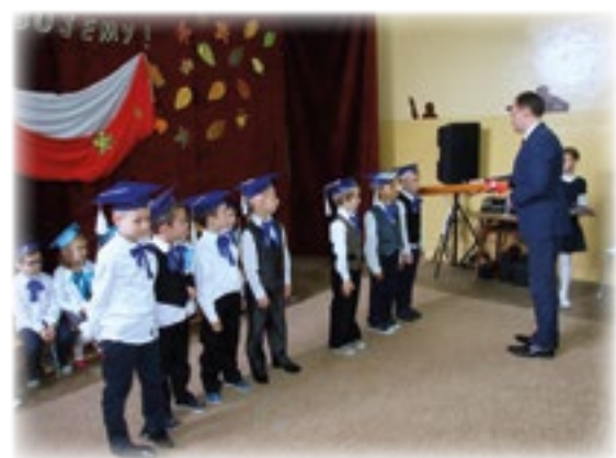
ZSP w Stawiskach

Ślubowanie uczniów klas pierwszych to bardzo ważne wydarzenie nie tylko dla najmłodszych, ale również dla ich rodziców, dziadków, bliskich. Pięknie zaśpiewane piosenki, z przejęciem wyrecytowane wiersze, wycisnęły niejedną łezkę z oczu bliskich.