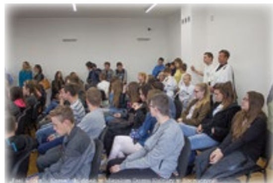
Tekst: UM Stawiski